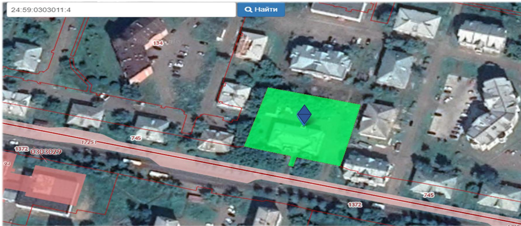
Схема расположения зданий на земельном участке