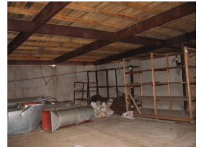
Здание гаража кирпичного