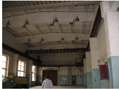
Производственное здание 1