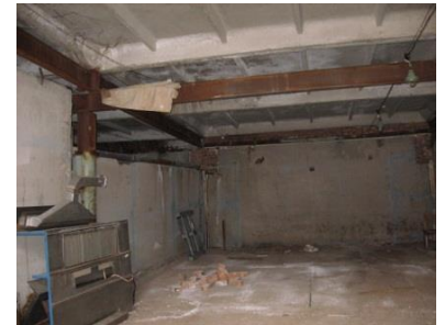
Здание гаража железобетонного