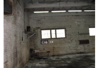
Здание гаража с хозяйственным пристроем