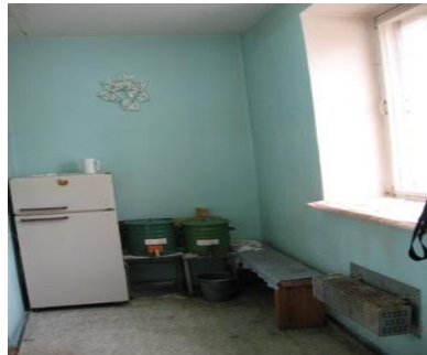
Здание пропускного пункта